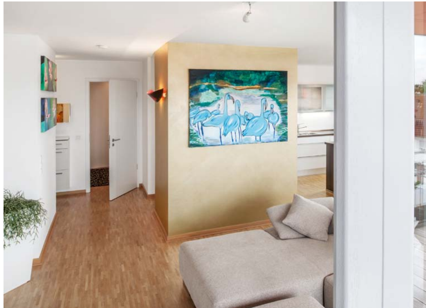
Edler Kontrapunkt zur gradlinien Farbgestaltung ist der vergoldete Raumteiler. Er beinhaltet gleichzeitig einen Abstellraum für die angrenzende Küche.