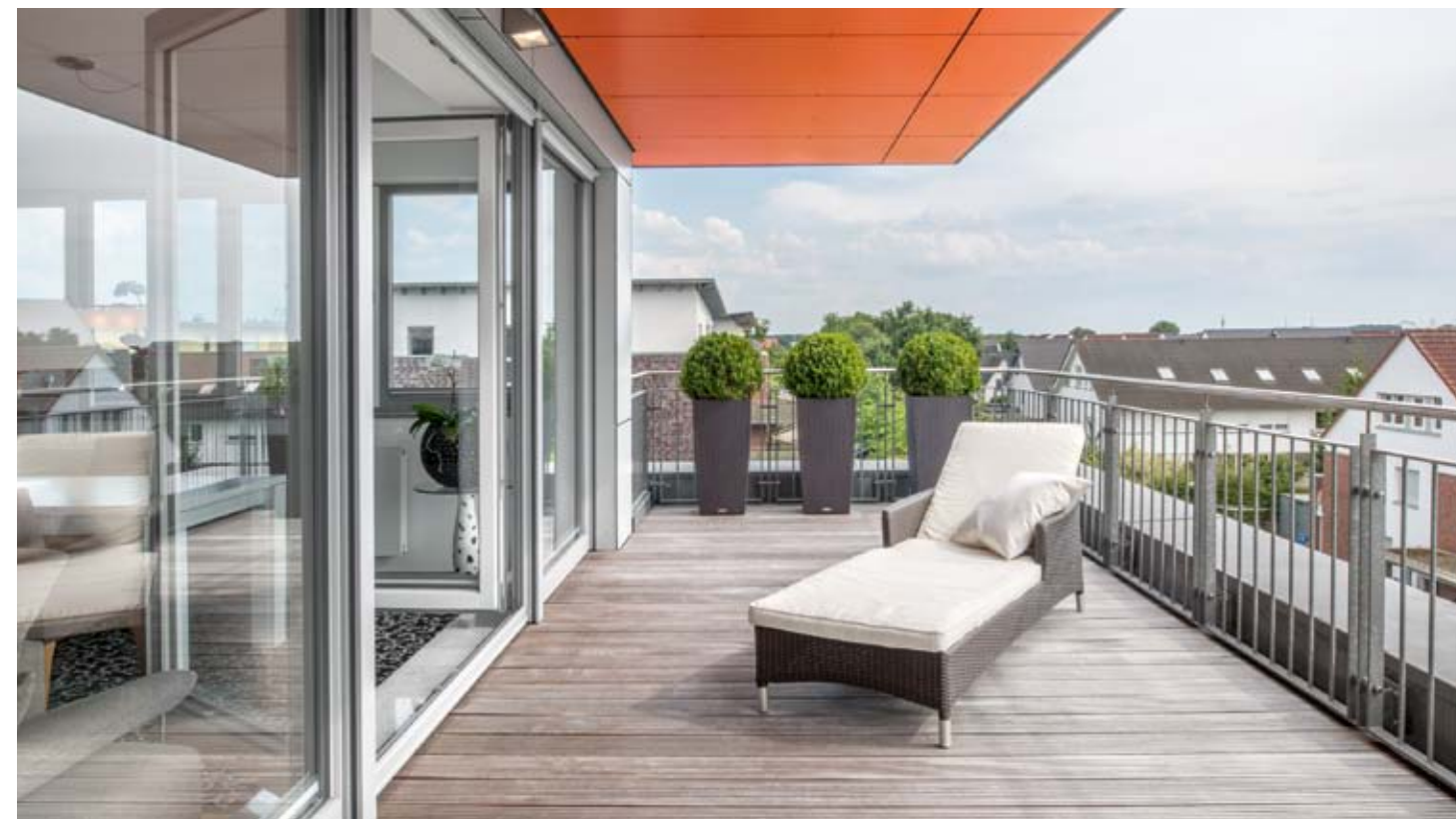
Neben den Balkonen des Hauses bietet die Dachterrasse des Penthouses vor einer großen Glasfront Platz zum Verweilen. Sie dient in der warmen Jahreszeit als zusätzlicher „Wohnraum“.