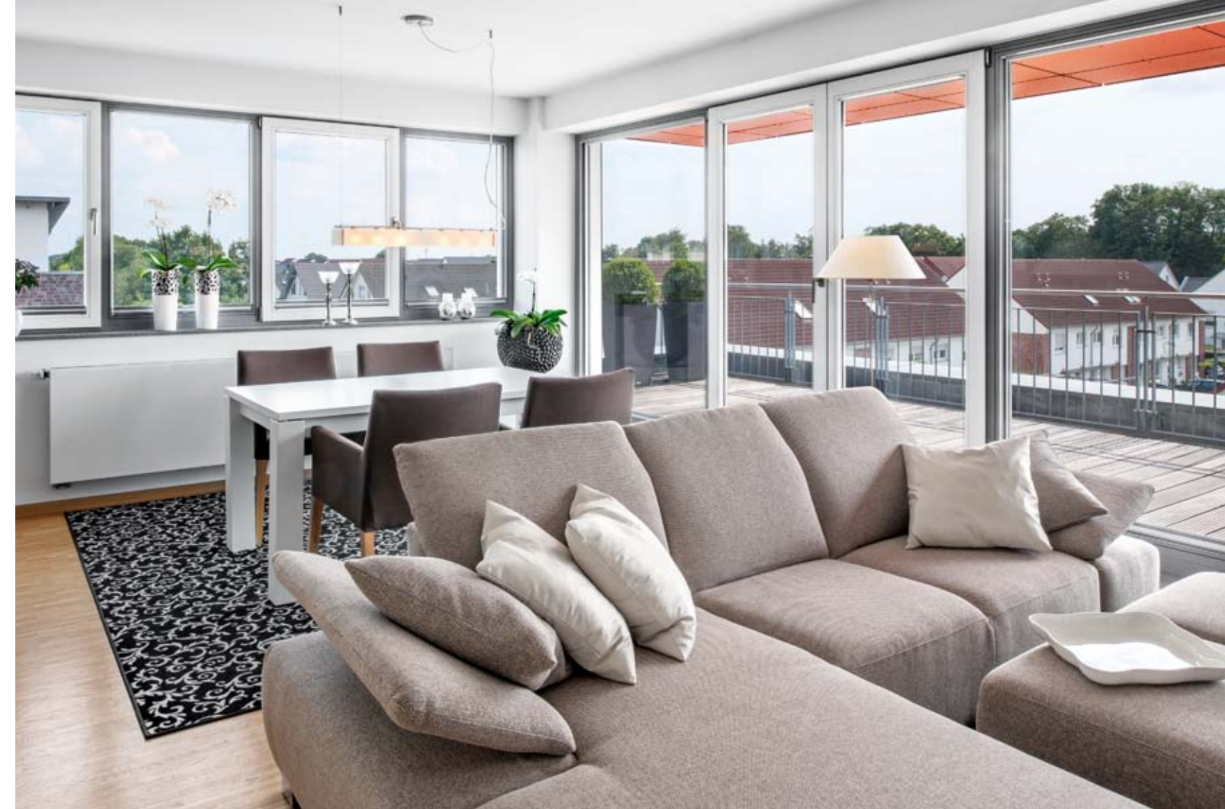
Holzfensterfronten lassen viel Licht herein, erhöhen den Wohnwert und bieten eine Rundumsicht über die benachbarten Dächer hinaus in die Weite der Landschaft. Die angenehme Haptik der Holzfenster ist ein positiver Nebeneffekt.